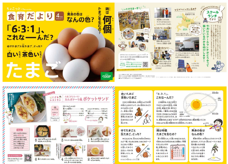
※食育だより初回発行号