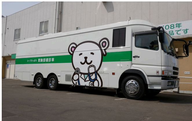
コープさっぽろが保有する健診車、現在3台保有