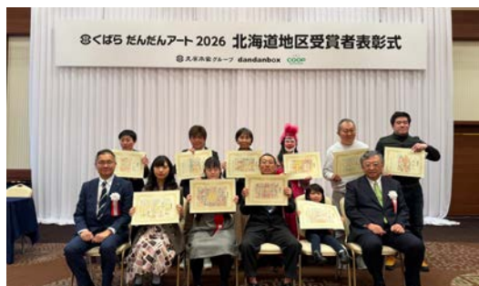
3月に行った表彰式の様子