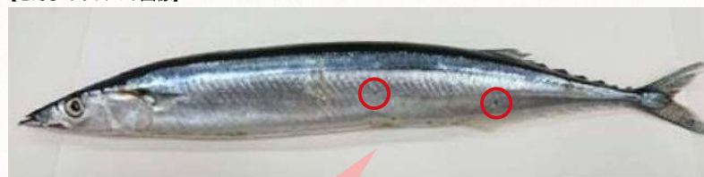
【さんまのウロコの画像】

さんまのウロコは非常にはがれやすく、漁獲する際にほとんど摩擦ではがれてしまいます。しかし、表面に残っていたり、はがれたウロコがさんまの口から入り、おなかの中から発見されたりすることもあります。