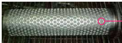
〈フィルターの一例〉

牛乳をはじめ、紙パック飲料の製造工程中では、いくつかの非常に目の細かいフィルターを通過させて異物の混入を防止しています。このため、異物が入ることはありません。