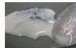
〈分離したヨーグルト〉

一度、凍った食品を食べても問題はありますが、見た目だけでなく、食感がもとに戻らないことがあります。例えば、凍ってしまったプレーンヨーグルトは、解凍すると分離して水っぽくなり、本来の食感、風味がなくなります。意外なものでは、みつ豆缶詰に入った寒天も、一度凍ってしまうとボロボロとした食感となってしまいます。