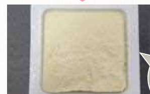
/凍るとこんなにしわしわに! \