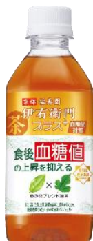
伊右衛門プラス 350ml 機能性表示食品