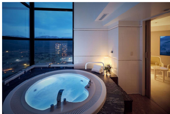
※リゾナーレトマム 施設イメージ