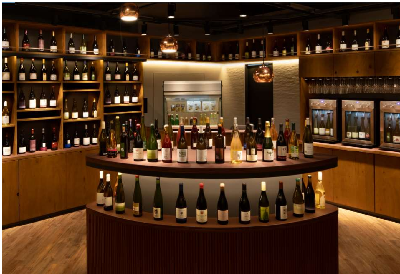
* TOMAMU Wine Houseイメージ

( https://drive.google.com/drive/folders/1jd6PvipoCJarhi-b2rgkzR-PbcvfQO7Q?usp=sharing )