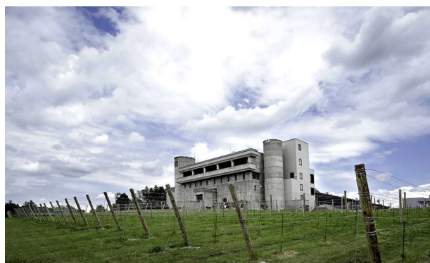
※ワイン城(池田町)イメージ