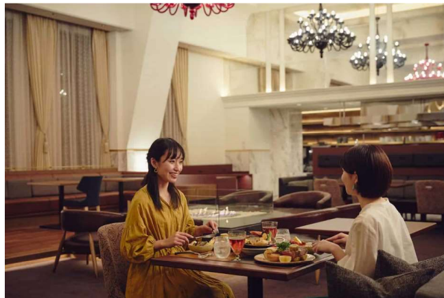
※OMO5小樽 by 星野リゾート 施設イメージ