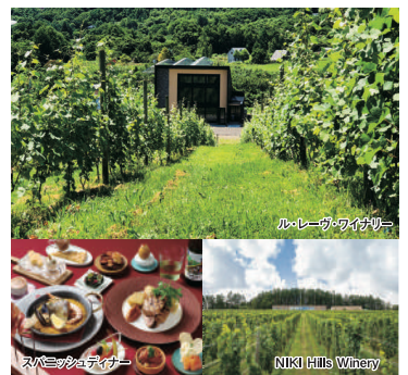
ル・レーヴ・ワイナリー