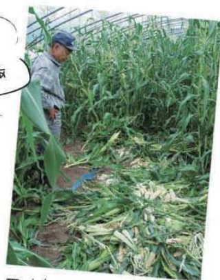
被害を受けた トウモロコシ畑