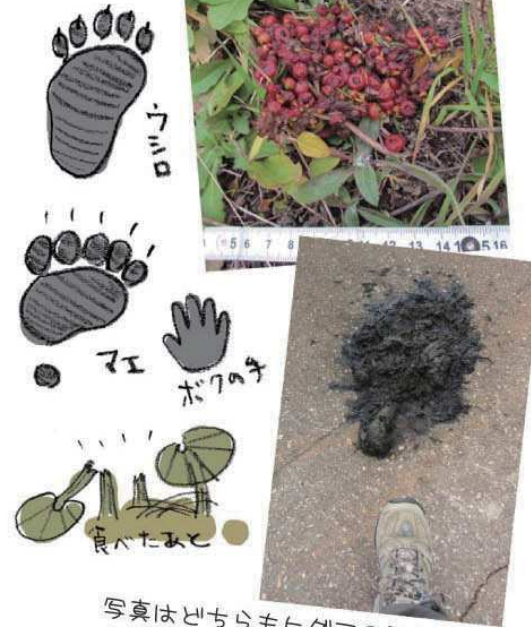
写真はどちらもヒグマのふん。大きいよ。食べたものによって色もさまざま

ヒグマは耳と鼻がとても敏感です。ですから、森に入るときは鈴などで音を立て、ヤブへ入る前に「おーい！入るよ」と叫び、パンパンッと拍手してこちらの存在を知らせましょう。出没情報やヒグマが通った跡にも気をつけましょう。土に残る足跡、フキを食べた跡、林道のフン。新しい跡だったら引き返してください。